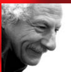
Rafael Álvarez 'El Brujo'

Teatro Romano Del 15 al 19 de julio, 23 horas