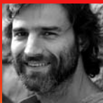
Alberto San Juan