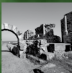
Teatro Romano de Regina